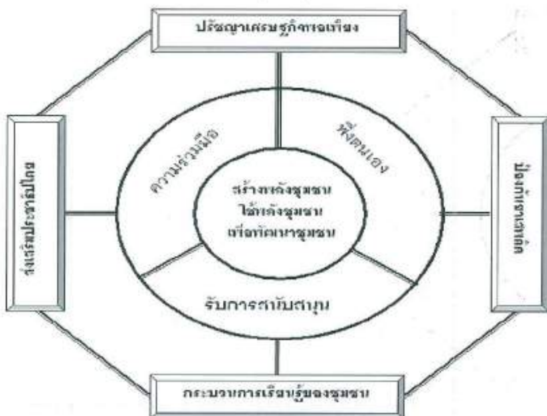
กรอบแนวคิดการจัดทำแผนสุขภาพชุมชนตำบลบ้านหัน

(๖) สนับสนุนและส่งเสริมการจัดบริการสาธารณสุข ( โครงการผ้าอ้อมผู้ใหญ่ แผ่นรองขับการขับถ่าย และผ้าอ้อมทางเลือก ) บุคคลที่มีภาวะพึ่งพิง และมีค่าคะแนนระดับความสามารถในการดำเนินกิจวัตรประจำวันตามดัชนีบาร์เธล เอดีแอล (Barthel ADL index) เท่ากับหรือน้อยกว่า ๖ คะแนน ตามแผนการดูแลรายบุคคลระยะยาวด้านสาธารณสุข (Care Plan)